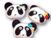
利用された皆さんに差し上げています

お問い合わせ 事務局 TEL・FAX 024-548-3711 E-mail office@pandahouse.org