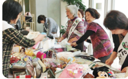
第5弾(H26.10.31) 会津医療センター・チャリティバザー