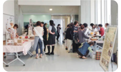
第7弾(H27.5.15) 会津医療センター・チャリティバザー