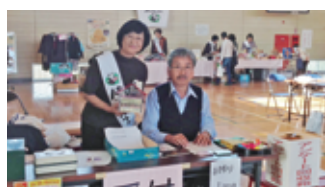
新そばまつり・バザー・募金活動(H26.10)