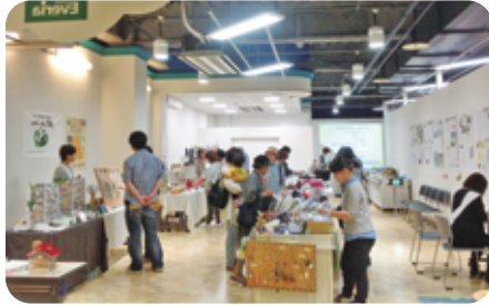
第4弾(H26.9.19~21) いわき鹿島ショッピングセンターエブリア 未来をつなぐ子ども達応援の輪