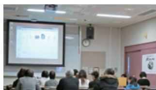
パンダハウスの集い(H27.2)