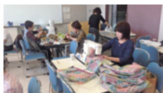
クリスマスプレゼント作り