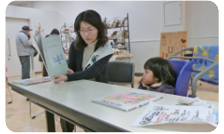
第6弾(H27.3.7~8) いわき鹿島ショッピングセンターエブリア 未来をつなぐ子ども達応援の輪(絵本読み聞かせ)