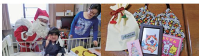
クリスマスプレゼント配布(H26.12)