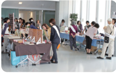
第3弾(H26.5.23) 会津医療センター・チャリティバザー