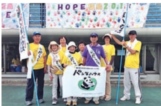
リレーフォーライフ に参加