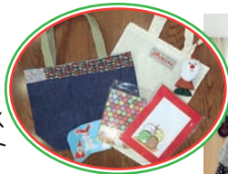
クリスマス プレゼント