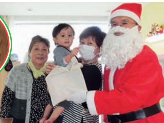
クリスマスプレゼント配布 (許可を得て掲載しています)