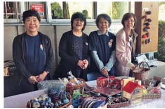
羽鳥湖マラソンバザーで参加