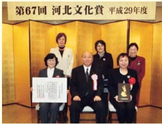
第67回 河北文化賞 平成29年度