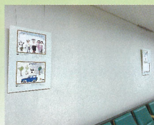
福島県立医科大学附属病院 きぼう棟2階廊下 令和3年9月～令和4年3月迄