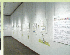
福島市写真美術館 令和4年1月5日～1月12日