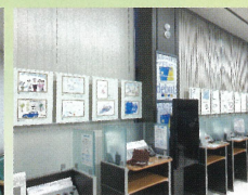
東邦銀行東福島支店 令和3年12月2日～12月27日