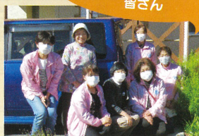
国際ソロプチミスト福島の皆さん