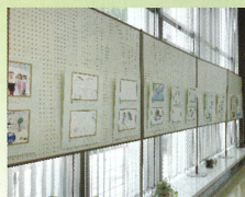
東邦銀行本店 令和3年9月6日～9月29日

令和3年度取組の日めくりカレンダープレゼントに掲載した子どもたちの絵を多くの皆様に観ていただきたいため、パネルにして各所で展示しています。