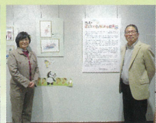
福島銀行 令和4年2月15日～3月11日